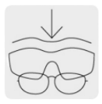
Sobre lente compatible con la mayoría de lentes graduados