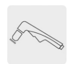
Uso en oxicorte