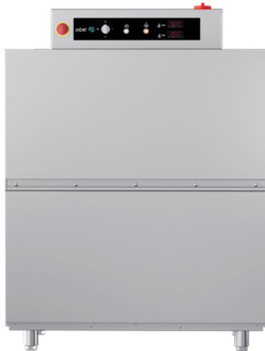
EASY-120 I CW SA / EASY-120 D CW SA

Sistema de detección de bloqueo del carro de arrastre y función de retroceso automático. Sistema de lavado de gran potencia con 4 ramas de lavado superiores y 4 inferiores. Sistema economizador de energía: reduce el consumo deteniendo el funcionamiento de las bombas y pasando el calentamiento del agua de enjuague a modo "stand-by" (70 °C). Sistema economizador en el lavado: el mismo no inicia hasta detectar el paso de la cesta, ahorrando agua y energía. Sistema economizador en el enjuague: el mismo finaliza cuando la cesta termina de pasar, ahorrando agua y energía. Auto-timer que desactiva el motor de arrastre al cabo de un tiempo de inactividad prefijado (10 minutos). Termostato de seguridad. Potencia y capacidad de la cuba de lavado: 9 Kw / 50 Litros. Potencia y capacidad del calderín de enjuague: 27 Kw / 21 Litros. Potencia de las bombas de lavado: 2 x 0,59 Kw. Consumo máximo de agua: 210 litros/hora. Conexión eléctrica: 230V. - 60Hz. (consultar al fabricante por opciones de conversión). Incluye micro de final de carrera. Cestas de 500 x 500 mm. Dotación: (2) cestas para platos modelo CP-16/18; (1) cesta para vasos modelo CV-16/105; (3) cestas generales.