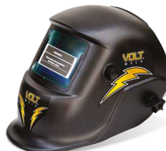
Empaque Master 6 Pza.

*Diseño exclusivo: Registrado ante IMPI por International Tool Company S.A de C.V.