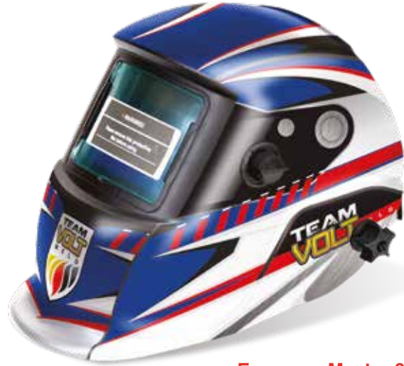
Empaque Master 6 Pza.

*Diseño exclusivo: Registrado ante IMPI por International Tool Company S.A de C.V.