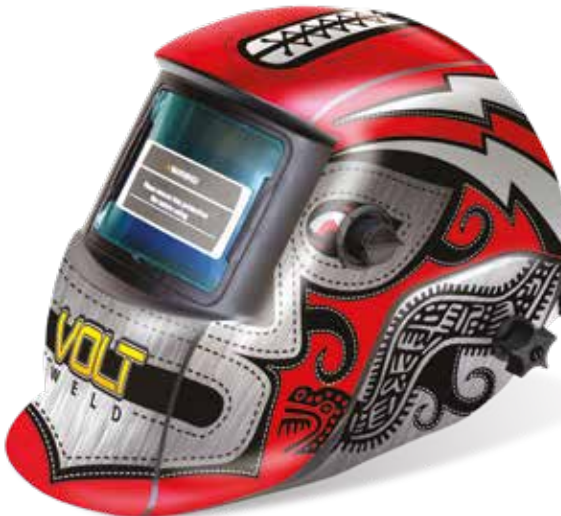
Empaque Master 6 Pza.

*Diseño exclusivo: Registrado ante IMPI por International Tool Company S.A de C.V.