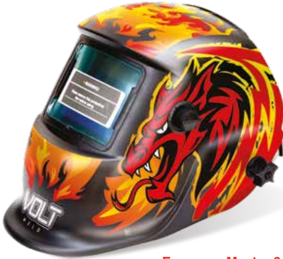
Empaque Master 6 Pza.

*Diseño exclusivo: Registrado ante IMPI por International Tool Company S.A de C.V.