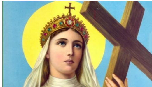
St. Helen of the Cross