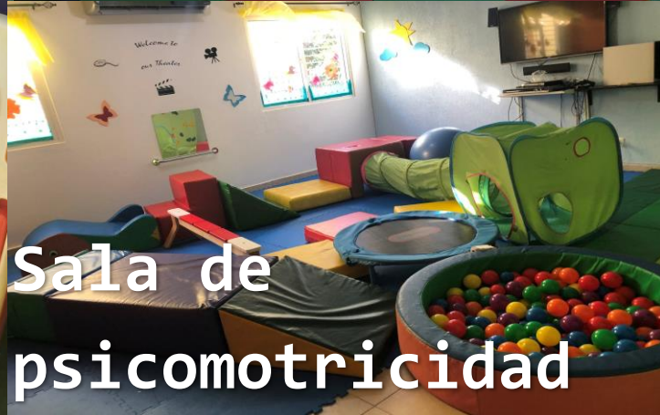
Sala de psicomotricidad

"Mientras más lees más sabrás. Mientras más sepas más lejos llegarás" Dr. Seuss