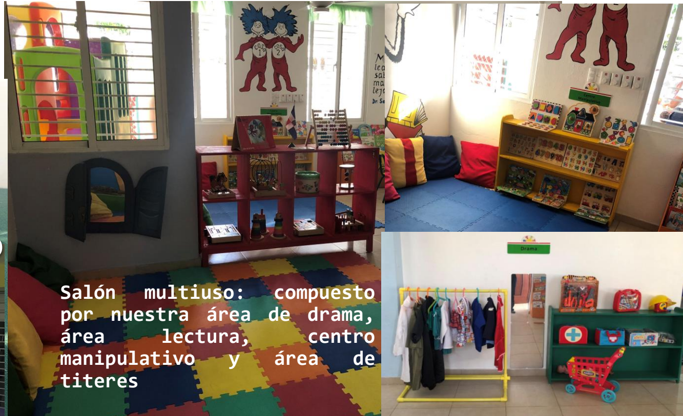
Salón multiuso: compuesto por nuestra área de drama, área lectura, centro manipulativo y área de títeres