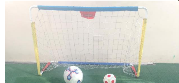
Áreas de patio