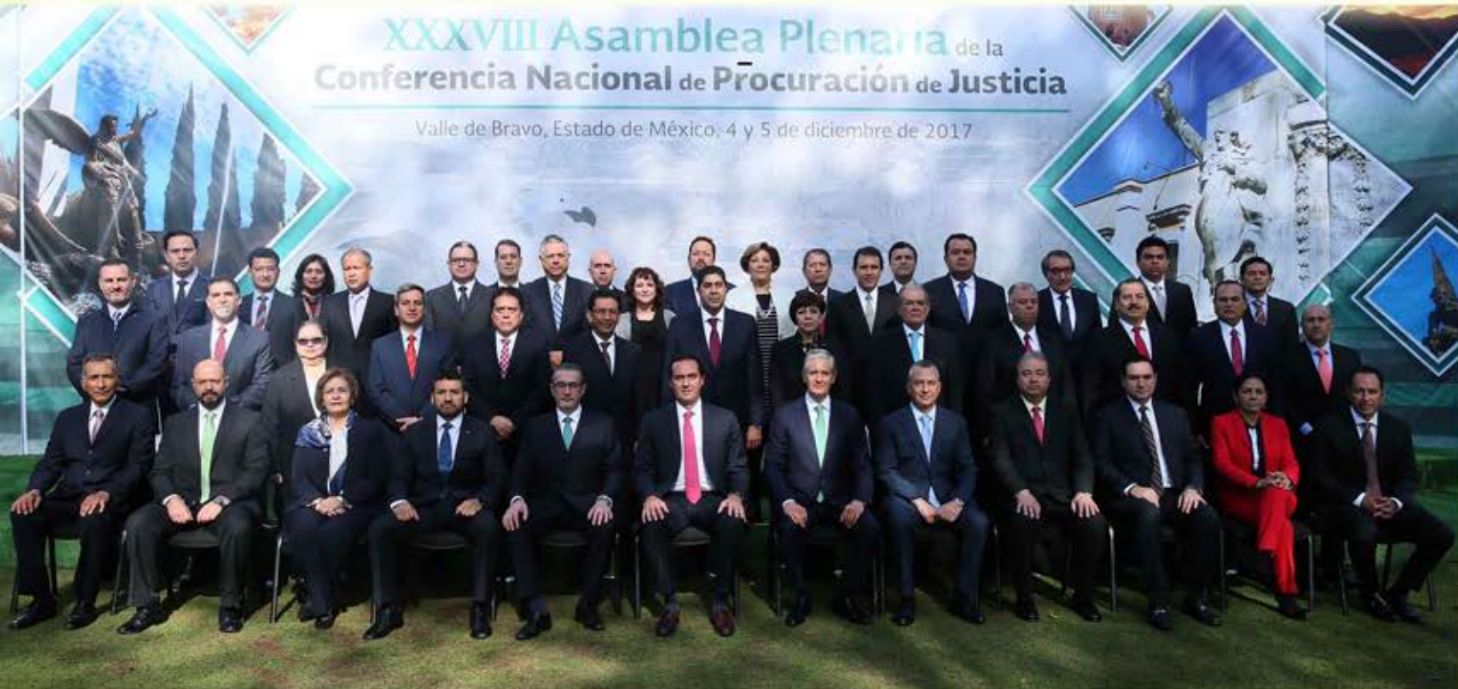
XXXVIII Asamblea Plenaria de la Conferencia Nacional de Procuración de Justicia Valle de Bravo, Estado de México; 4 y 5 de diciembre de 2017