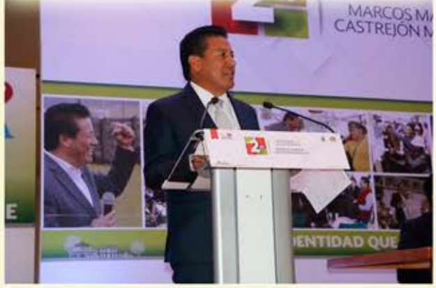
Zinacantepec, Méx.- El presidente municipal de Zinacantepec, Manuel Castrejón Morales, ante Jafet Millán Márquez, representante del gobernador del Estado de México, Alfredo del Mazo Maza y el cabildo en pleno, rindió su segundo informe de gobierno, en el que destacó que "Durante estos dos años de gobierno, gracias al apoyo y participación de todas y todos los Zinacantepecenses, hemos logrado la realización de obras y acciones en cada una de las 48 localidades que integran nuestro Municipio, convencidos de que cuando trabajamos unidos en un mismo objetivo, somos capaces de superar cualquier reto".