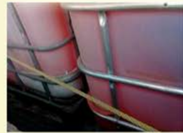
Por Agencia MVT.

Aculco, México, 8 de enero 2018.- Elementos de la Secretaría de Seguridad del Estado de México (SSEM), en