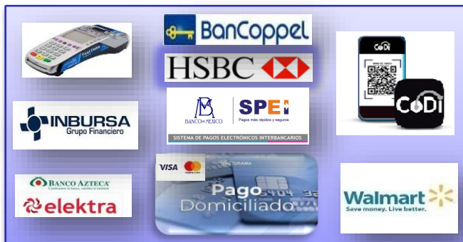
Múltiples y accesibles formas de pago