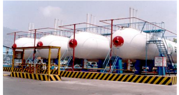
Planta Almacenadora de Gas L.P. 4 Almacenes de 250,000 lts C/U.