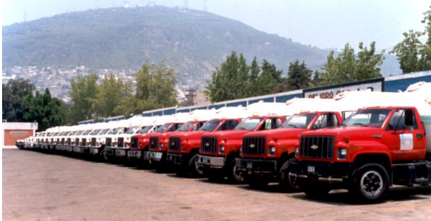
Flotilla de reparto de Gas L.P. Con unidades verificadas por SENER

Satisfacer las necesidades de nuestros clientes consumidores de Gas L.P del mercado Condominal y/o Habitacional, mediante la administración y distribución eficientes, a través de un servicio profesional que se distingue por la honestidad, seguridad y puntualidad, mismo que garantizamos con personas jóvenes, competitivas y ejemplo de nuestros valores. Nuestra misión contribuye al desarrollo, tranquilidad y crecimiento de la comunidad que Administramos, adaptándonos a las exigencias y condiciones actuales de nuestros clientes y entorno, garantizando una mejora continua de nuestro servicio.