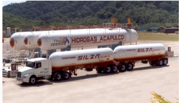
Transporte para Abastecimiento a planta de Distribución

Sin mas por el momento y esperando que esta información sirva como referencia para prestar nuestros servicios, me despido de Usted quedando como su servidor.