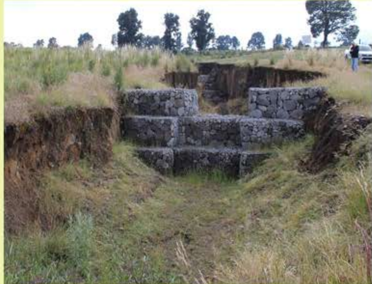
Se benefician mil 333 hectáreas en 18 municipios del Edomex

La Comisión Nacional Forestal (CONAFOR) del Estado de México asignó este año 18.6 millones de pesos para acciones de restauración forestal en mil 333 hectáreas de 18 municipios que forman parte de la Cuenca alta del Río Lerma.