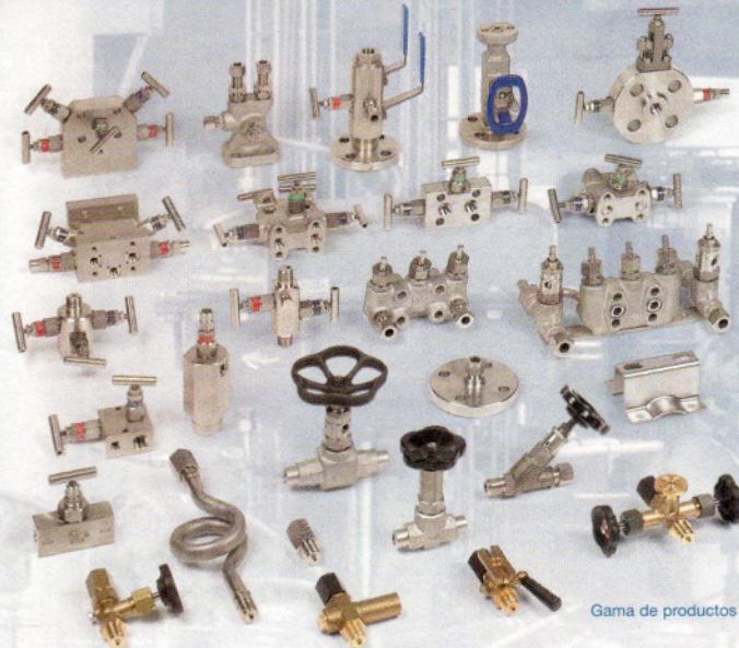
Gama de productos

En este sector, Schneider es una de las empresas pioneras a nivel internacional y suministra estos productos a clientes en todas partes del mundo.