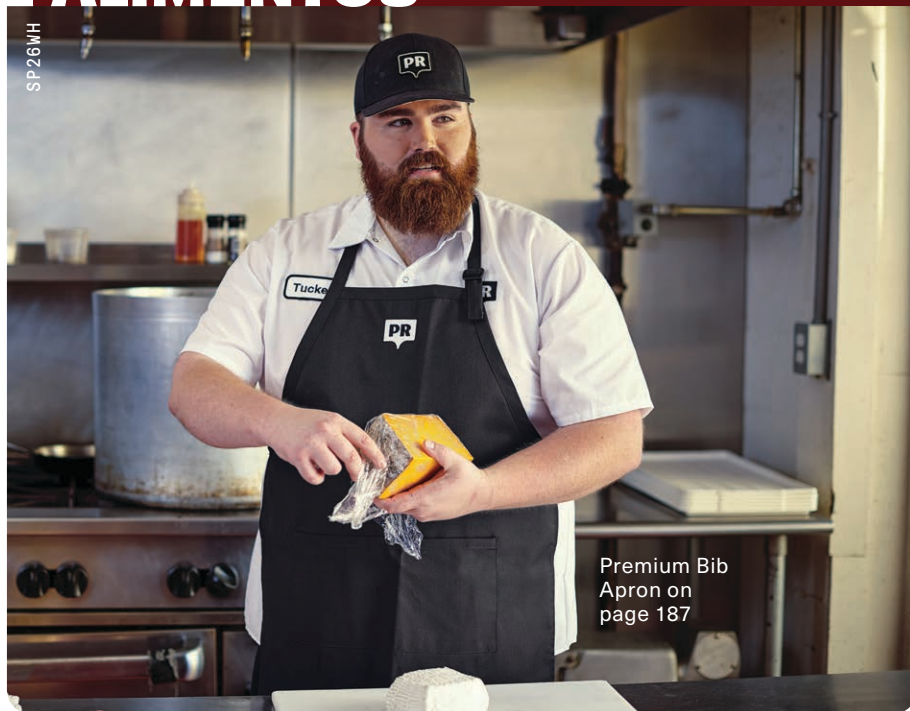
Premium Bib Apron on page 187

SP26 MANGA CORTA PARA HOMBRES (reg.) S-6XL*, (larga) L-4XL*