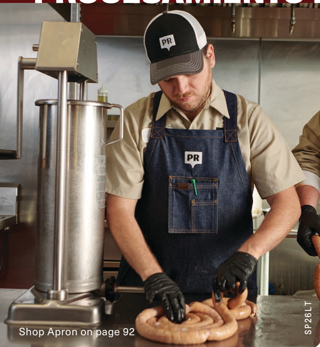
Shop Apron on page 92