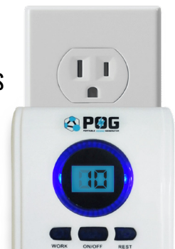
POG À BRANCHER