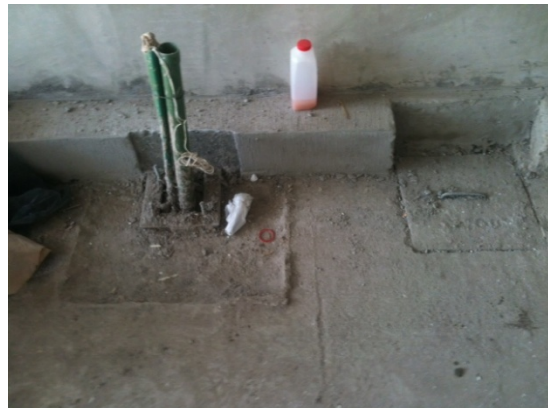
Imagen 3. Guarnición obstruye el montaje del poste ordenador e impide la apertura de puerta para manipulación de componentes, por lo que debe adecuarse el establecimiento eliminando la guarnición.

Imagen 2. La guarnición detrás de la base del poste ordenador no permitirá la manipulación de equipo y la conexión de cables.