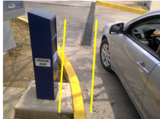
Imagen 2. La mejor práctica es tratar que el Poste Ordenador quede situado en paralelo con el vehículo.