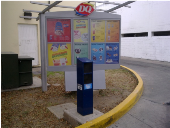
Imagen 1. Si el Poste Ordenador va montado en curva, su base debe orientarse y prever que el poste quede de frente a la puerta del vehículo.