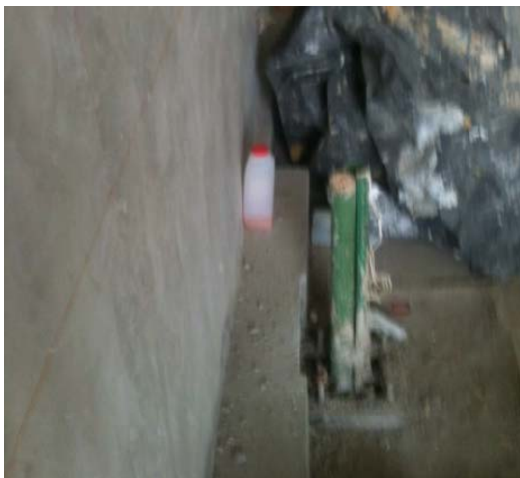
Imagen 4. Se sugiere al menos 40-50 cm libres detrás del poste para permitir la conexión y mantenimiento del equipo. La base del poste ordenador debe quedar expuesta, no debe sumergirse en la cimentación.

Imagen 3. Guarnición obstruye el montaje del poste ordenador e impide la apertura de puerta para manipulación de componentes, por lo que debe adecuarse el establecimiento eliminando la guarnición.