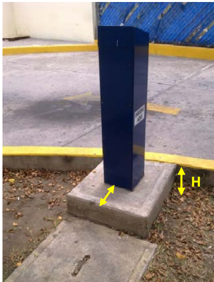
Imagen 3. El Poste Ordenador tiene una puerta trasera que permite al técnico manipular equipo y conectar cables. La cimentación se coloca a la misma altura que la guarnición.