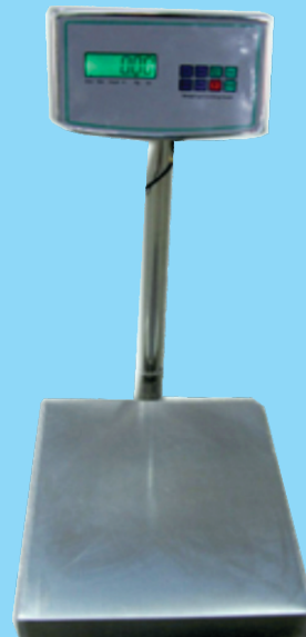
Modelo BPW ✓ A Prueba de Agua 100% Acero Inoxidable