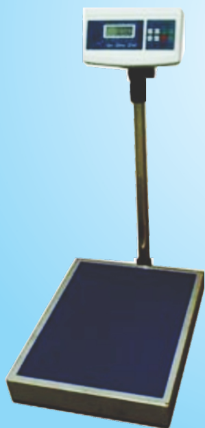
Modelo BP ✓ Plato en Acero Inoxidable