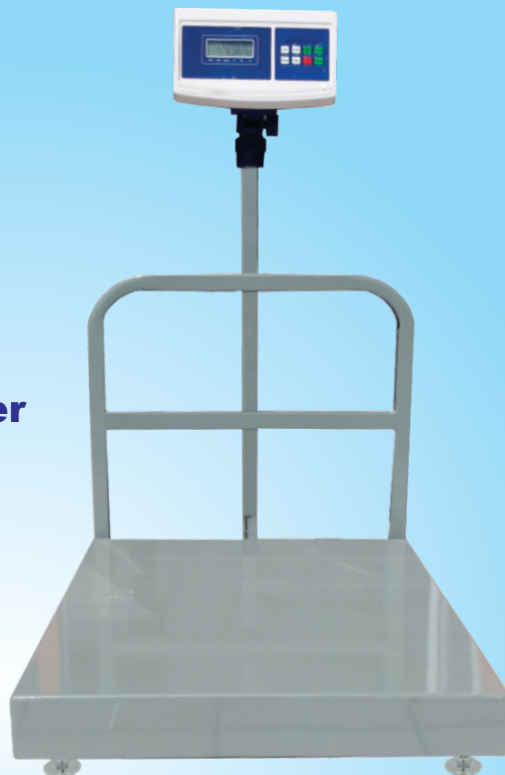
Modelo BPX ✓ Capacidad Ajustable Desde 200kg hasta 1,000kg