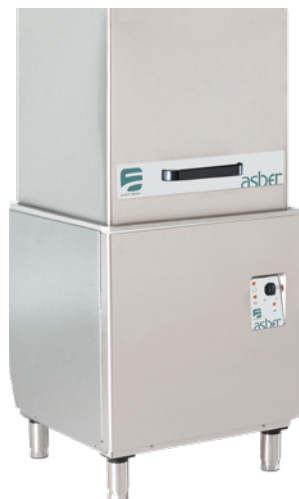
EASY-H500 SA / EASY-H500 HP SA

Fabricación de estructura compacta, totalmente en acero inoxidable. Panel de mandos electromecánico. Cuatro (4) ciclos de lavado: corto (55"); normal (75"); intenso: (120"); continuo hasta su parada normal. Incorpora doble sistema de filtros en la cuba y en el desagüe. Válvula anti-retorno. Termostato de seguridad. Dosificador de abrillantador. Micro de seguridad a la apertura de la puerta. Temperatura de lavado regulada a 60 °C y de enjuague a 85 °C. Potencia y capacidad de la cuba de lavado: 4,5 Kw / 45 Litros. Potencia y capacidad del calderín de enjuague: 12 Kw / 7 Litros. Potencia de las bombas de lavado: 2 x 0,6 Kw. (*) Consumo de enjuague: 3 litros por ciclo. Conexión eléctrica: 230V. - 60Hz. (consultar al fabricante por opciones de conversión). Acepta cestas de 500 x 500 mms. Dotación: (1) cesta general modelo CT-10, (1) cesta para platos modelo CP-16/18 y (2) cestillos para cubiertos modelo CU-7.