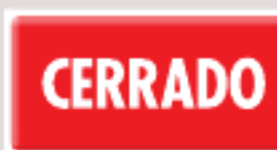
Modelo 227 Doble Vista