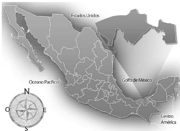
Figura 1. Ubicación geográfica del estado de Tabasco del sureste mexicano