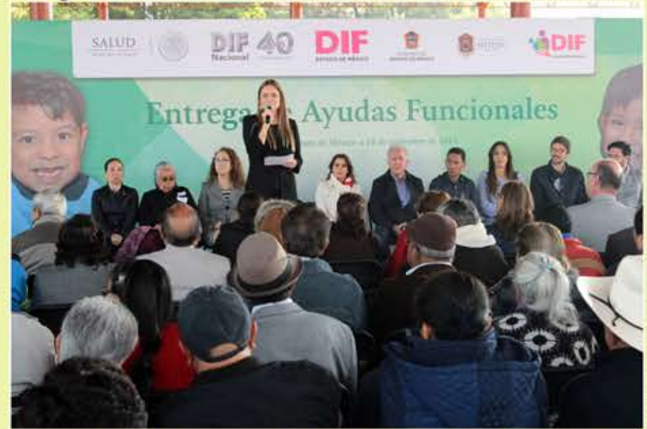
Agregó que el DIF Metepec se enfoca en la construcción de un municipio incluyente, prueba de ello son las audiometrías a bajo costo que se ofrecen en la Unidad de Rehabilitación e Integración Social, así como la valoración