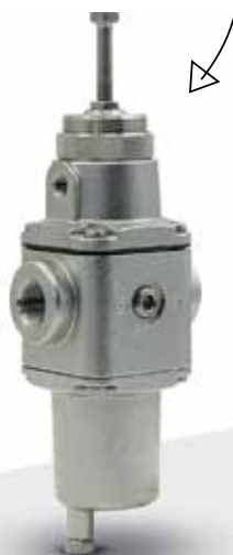
Filtro/regulador Norgren en Acero Inoxidable Serie B38