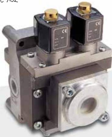
Válvulas de Seguridad en Prensa Herion Serie XSZ

Imagina construir un rascacielos en la jungla: construir una plataforma de hundimiento de pozo en un lugar remoto puede ser igual de desafiante. Los actuadores para los gatos que sostienen la plataforma firmemente contra el eje tienen que extenderse y retraerse de manera confiable, incluso en condiciones extremas para mantener tu operación sólida y segura.