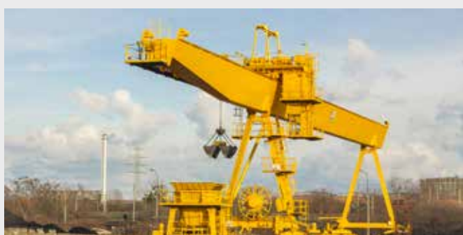
Estaciones de Carga