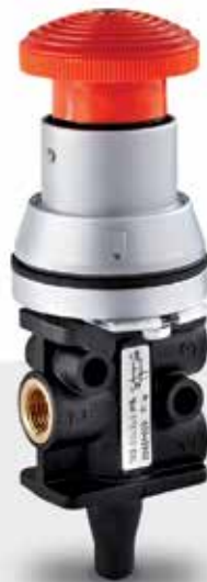
Actuadores Norgren Serie Roundline Plus