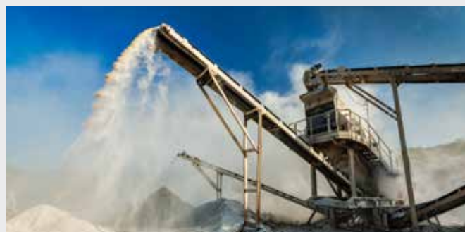
Minería de Superficie: Canteras