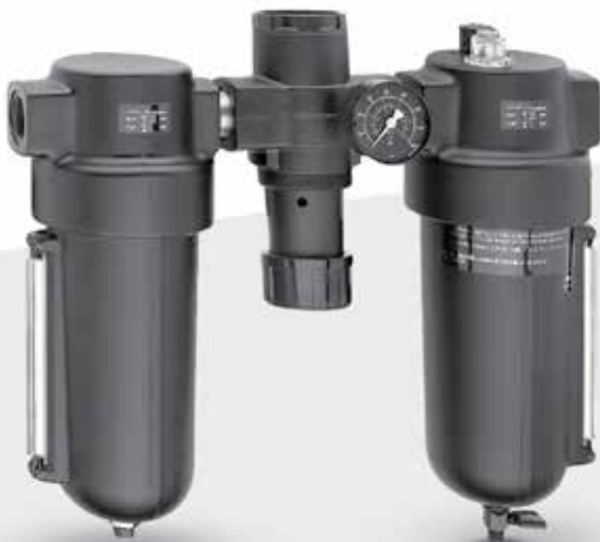
FRL's Norgren Serie 17