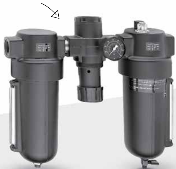
FRL's Norgren Serie 17