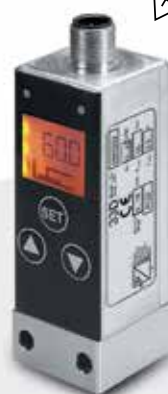
Interruptores de Presión Norgren Serie 18D y Herion Serie 38D