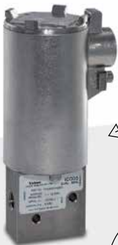
Válvulas Solenoides Maxseal Serie 1003S