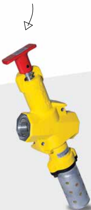
Válvulas de Bloqueo en Línea Norgren Serie CR04/C002