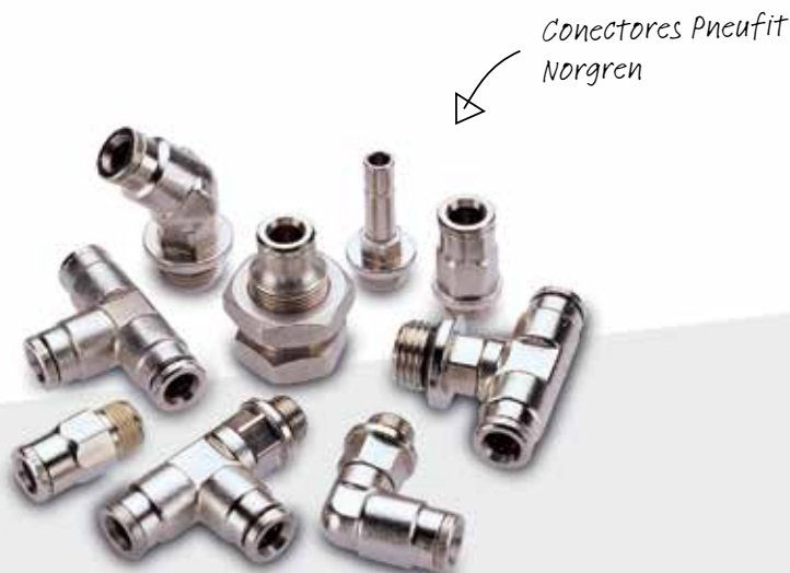
Conectores Pneufit Norgren