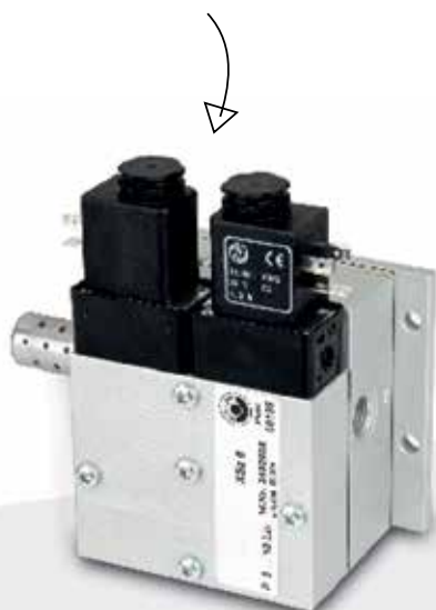
Válvulas de Seguridad en Prensa Herion Serie XSZ