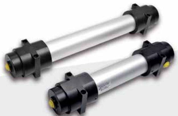
Válvulas de Drenaje Electrónicas 17-020-300