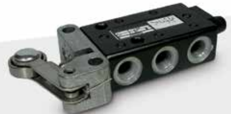
Válvulas Mecánicas y Manuales Norgren Serie Super X y Nugget 200