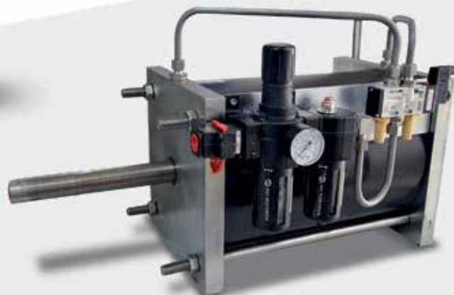
Actuador Ecomaxx Norgren