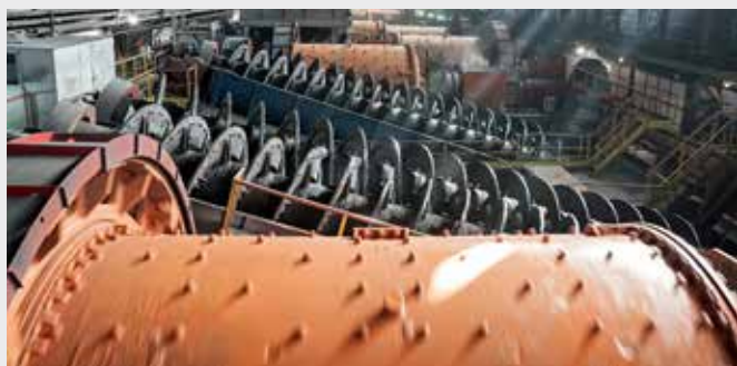
Procesamiento en Plantas