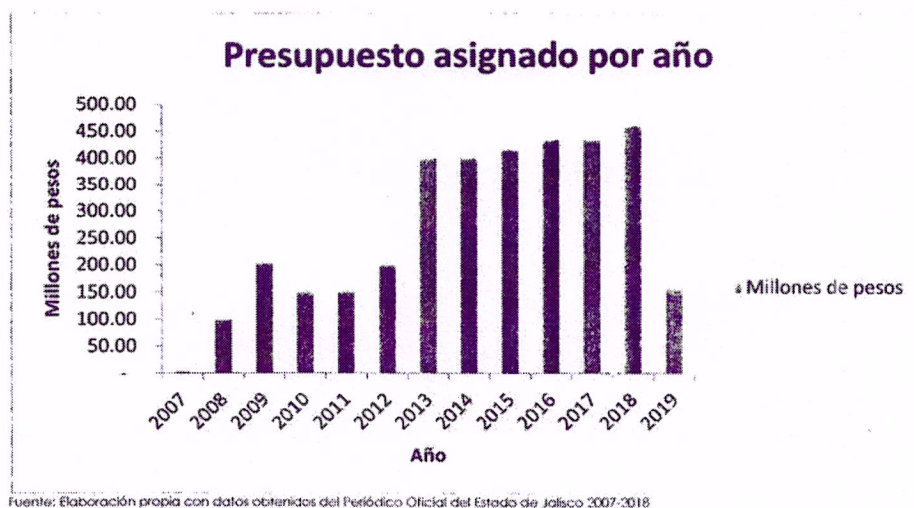
Gráfica 2. Monto anual del presupuesto (en millones de pesos) asignado al "Programa de Atención a los Adultos Mayores" (2007-2009), Estrategia de Atención a los Adultos Mayores "Vive Grande" (2010-2012) Atención a los Adultos Mayores (2013-2018) y Atención Integral del Adulto Mayor (2019)

Fundamentalmente, el objetivo del programa dejó de ser el de "otorgar una pensión alimenticia" por el de "contribuir a reducir la condición de vulnerabilidad de la población mayor de 65 años que no recibe ingresos por jubilación y pensión".