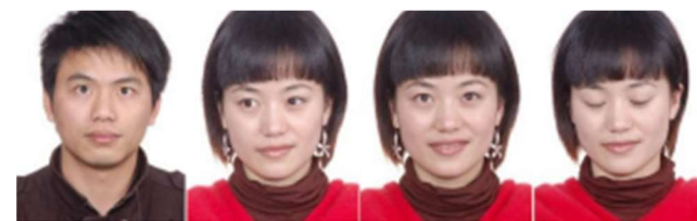
Mirada no natural Mirada a la izquierda Mirada arriba Ojos cerrados