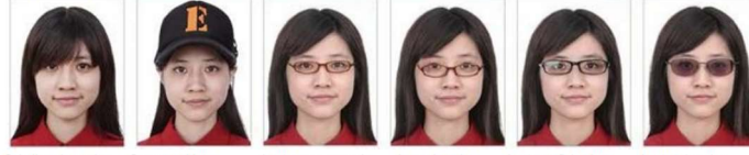
Cabello cubre cejas Orejas y frente Gorras u objetos que cubren la frente y orejas Lentes con armazón grueso Armazón cubre los ojos Lentes reflejan luz lights Lentes de color