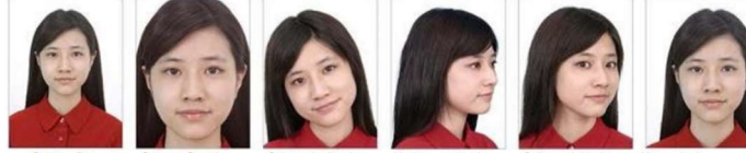
Cabeza Pequeña Cabeza Grande Cabeza Inclinada Hacia un costado Cabeza doblada No centrada