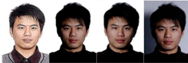
Demasiada nitidez Sombra izquierda Sombra derecha Sombra de fondo