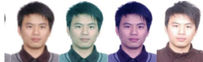
Persona borrosa Tono muy verde Tono muy azul deslumbrada