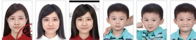
Imagen de portada Con Color de la ropa y fondo similar La imagen está dañada o tiene Otros objetos capturados Persona haciendo Expresión facial antinatural o