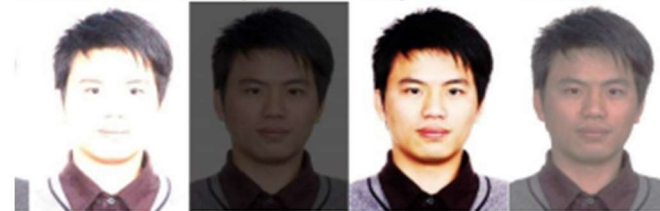
sobreexpuesta subexpuesta Contraste muy Contraste bajo