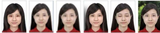
Ojos rojos Baja resolución Imagen borrosa Sombra de fondo Ojos Cerrados Fondo incorrecto